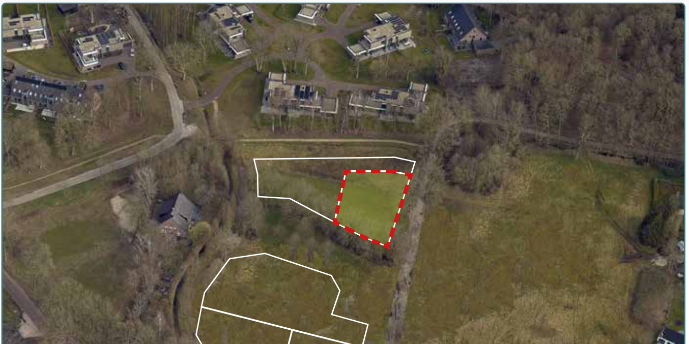
Kavel 163 vanuit de lucht