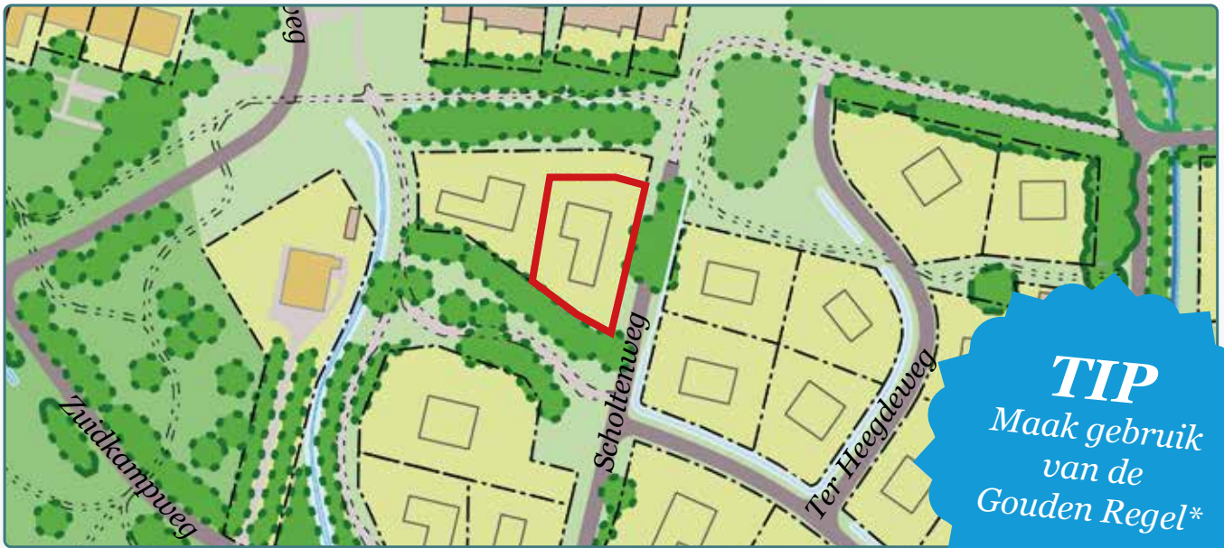
Situatietekening kavel 163